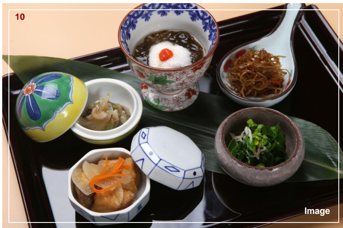
▲ 今日五色冷盆 / 本日の酒の肴五種盛り