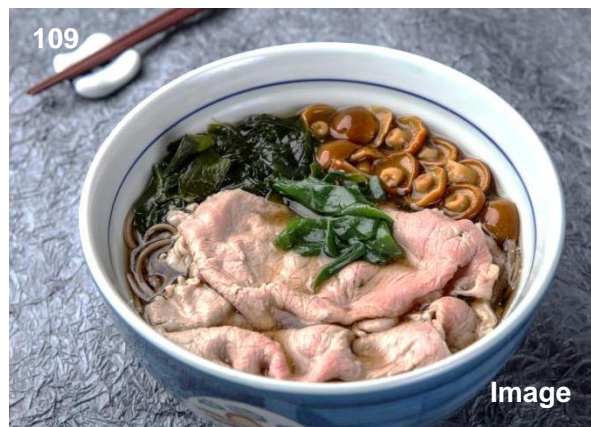
▲M9 牛肉荞麦汤面/特上牛肉そば