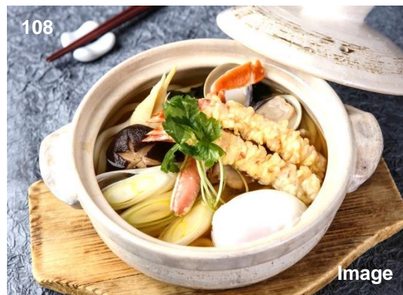
▲砂锅乌冬面/鍋焼きうどん