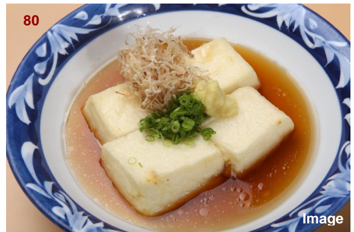
▲炸豆腐/揚げ出し豆腐