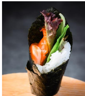
三文鱼牛油果手卷