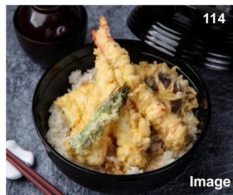
▲ 炸明虾蔬菜盖饭/天丼