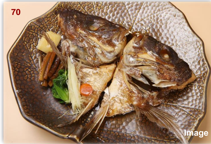
▲煮加级鱼头/鯛のあら煮