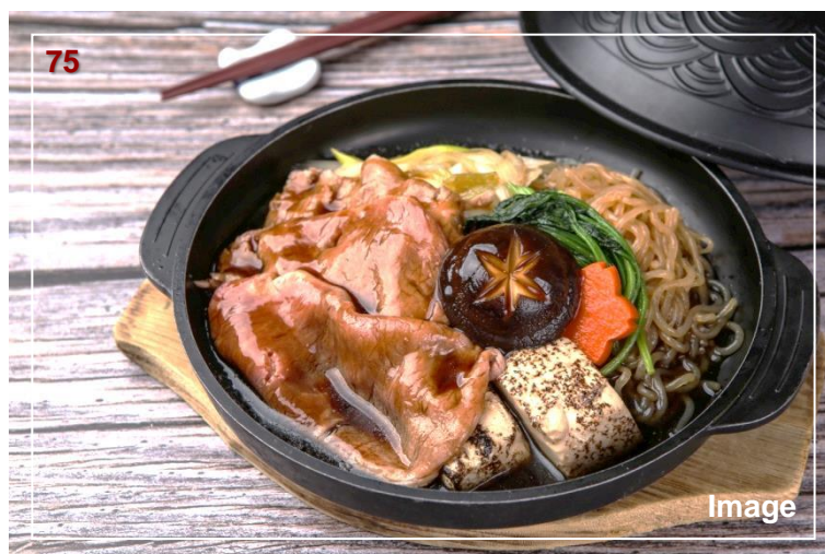
▲牛肉寿喜煮锅(澳洲 M9 纯血种牛)/牛すき煮鍋