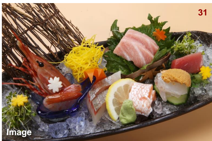
▲五色生鱼片拼盆/お造り五種盛り合わせ