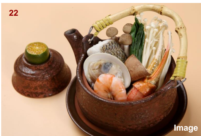
▲海鲜茶壶汤/海鮮土瓶蒸し