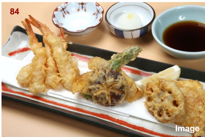
▲天麸罗『松』/天麩羅盛り合わせ『松』