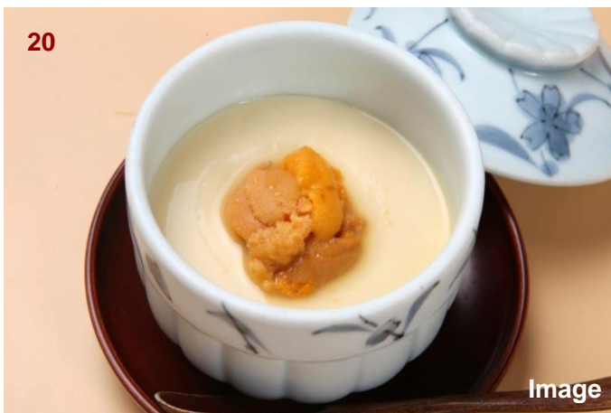
▲海胆鸡蛋羹/雲丹茶碗蒸し