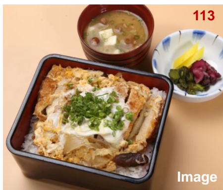
▲ 日式猪排盖饭/かつ重