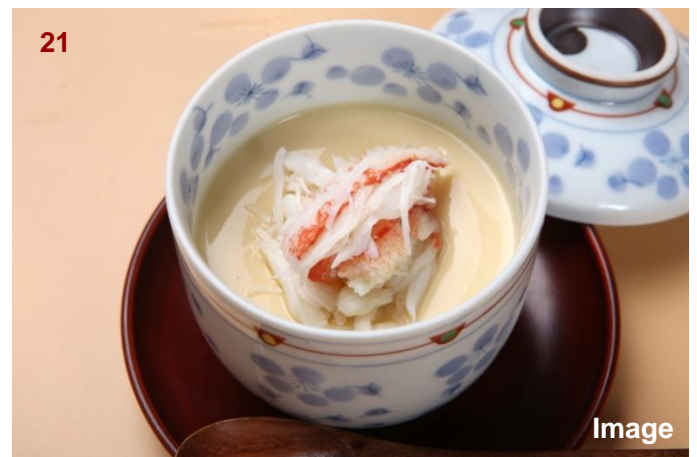
▲蟹肉鸡蛋羹/蟹茶碗蒸し